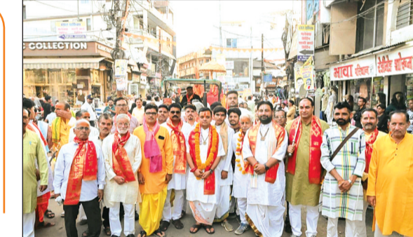
विदिशा। शोभायात्रा में धर्म रक्षा के कार्य कर रहे विद्वान ब्राह्मण शामिल हुए।

भगवान श्री परशुराम जयंती पर विप्र समाज द्वारा पेढ़ी चौराह से भव्य शोभायात्रा निकाली गई। पेढ़ी चौराह से प्रारंभ होकर विभिन्न मार्गों से होते हुए शोभायात्रा बाल विहार पहुंची, जहां शोभयात्रा धर्मसभा में परिवर्तित हुई। रास्ते में जगह जगह लोगों द्वारा भव्य स्वागत किया गया। चल समारोह में भगवान परशुराम की आकर्षक झांकी