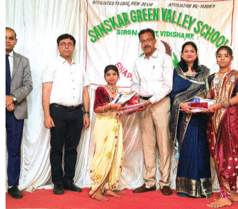
हरिभूमि न्यूज ▶▶सिरोंज

कक्षा 10वीं में 90 प्रतिशत अंक प्राप्त करने वाले छात्रों को कक्षा 11वीं में मिलेगा निःशुल्क प्रवेश